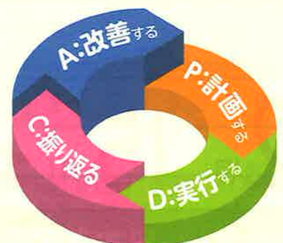
理想的な学習の流れ(学習習慣)

この力は、高校入試への挑戦や自分の希望の将来を実現させるための大きな後押しとなります!