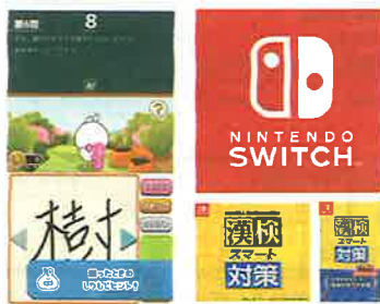
Nintendo Switchのロゴ Nintendo Switchは任天堂の商標です。