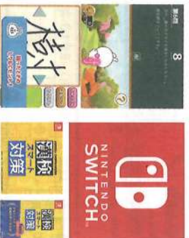
Nintendo Switchのロゴ Nintendo Switchは任天堂の商標です。