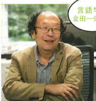
言語学者 金田一先生の