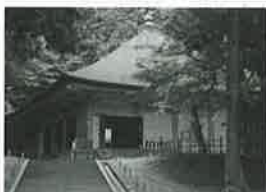
資料1 中尊寺金色堂

の位置を表す記号と、②資料2が建てられた室町時代にアイヌの人々との交易で栄えた資料3のXの地名の組み合わせを、あとから1つ選びなさい。